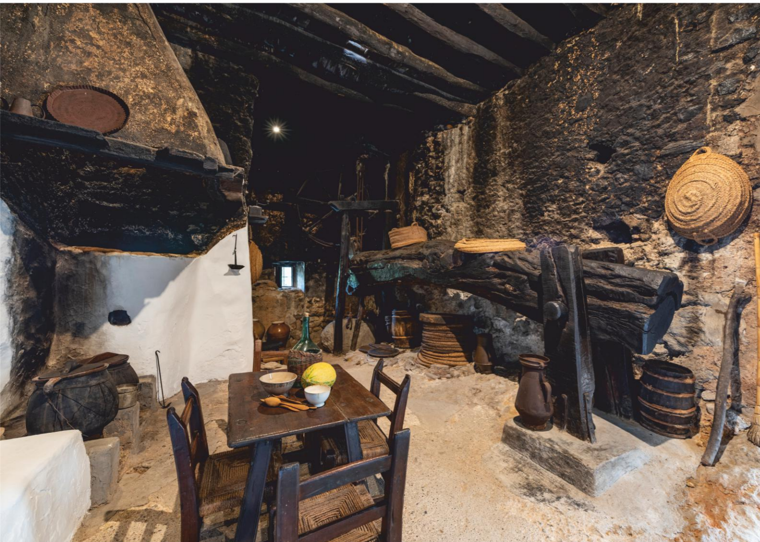
Cuina de Ca n'Andreu des Trull (Sant Carles de Peralta)