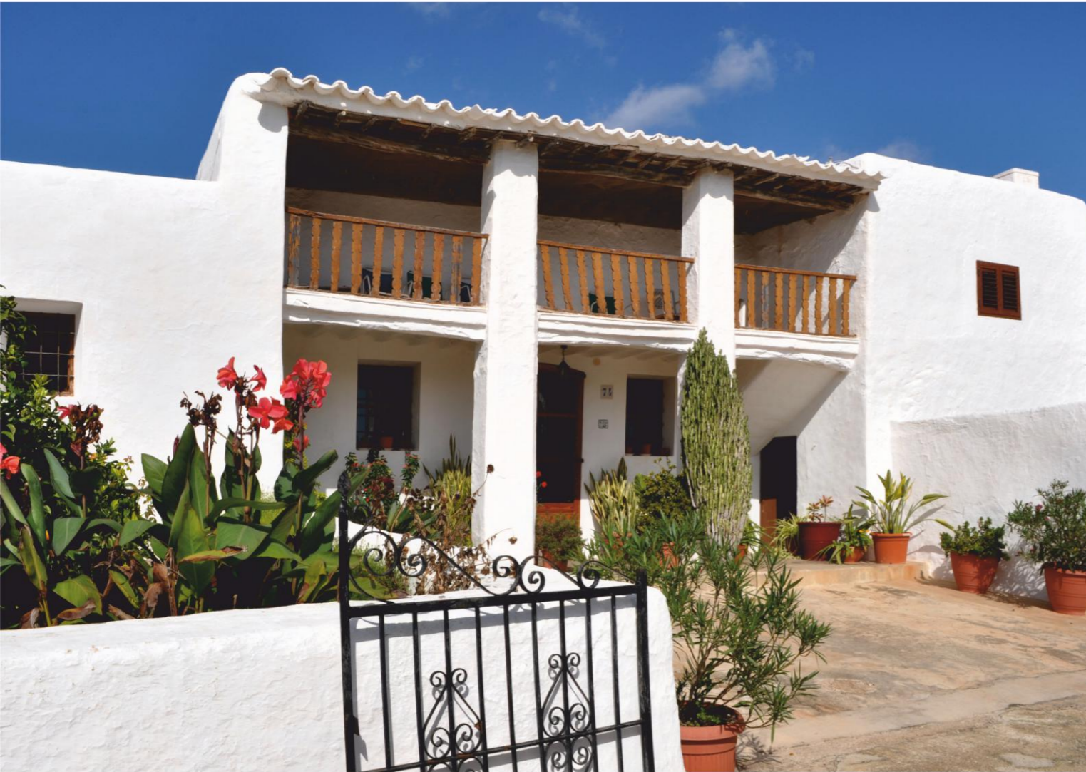
Can Mariano d'en Roques (Sant Carles de Peralta)