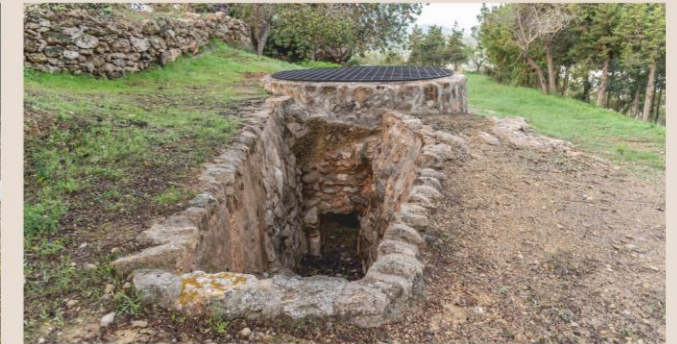
Forn de calç / Horno de cal

Ca n'Andreu des Puig o ca n'Andreu des Trull és un antic casament documentat des de 1730, que als anys 90 del segle XX va passar a mostrar la vida rural i tradicional d'Eivissa amb una important col·lecció museística d'estrils rurals utilitzats al camp, mobiliari tradicional, així com altres elements d'ús quotidià, necessaris en una societat com l'eivissenca, caracteritzada per un sistema d'autosubsistència durant tants de segles.