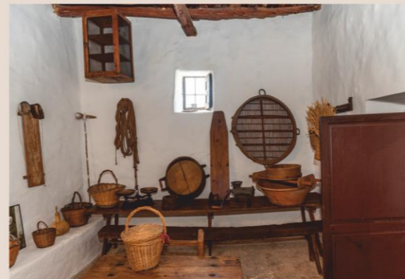
CA N'ANDREU DES TRULL