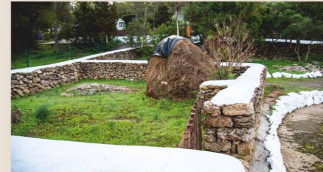
Paller / Pajar